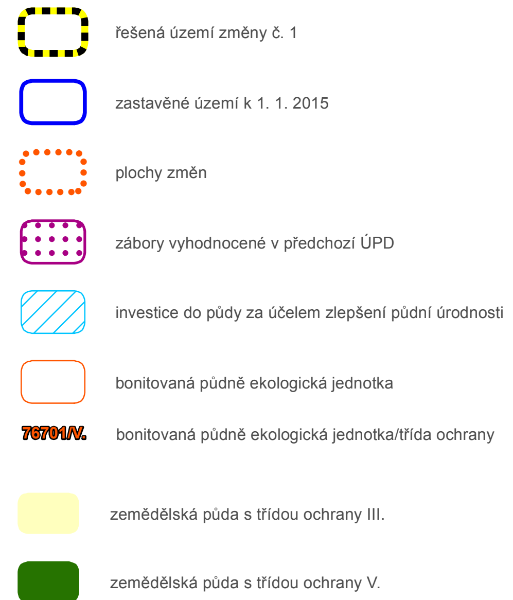
E - výkres předpokládaných záborů půdního fondu změna č. 1 územního plánu Přeštěnice